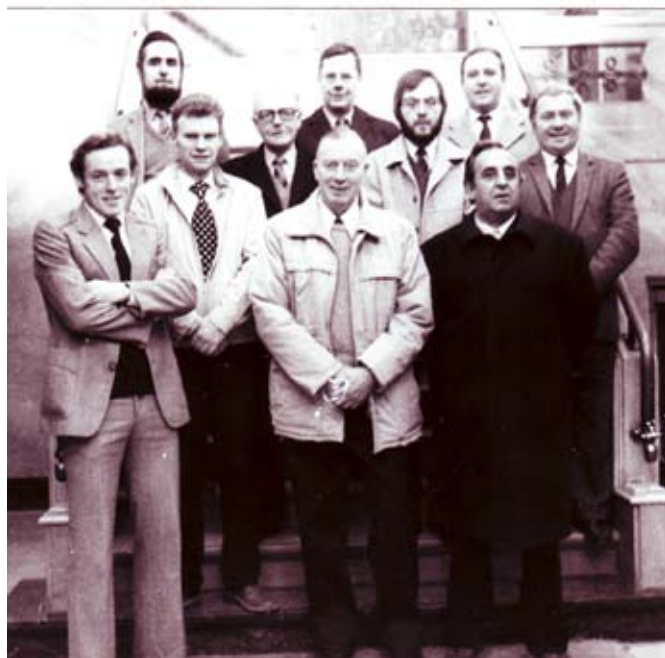
Het bestuur van de Zeelse Fair-playclub in 1982.